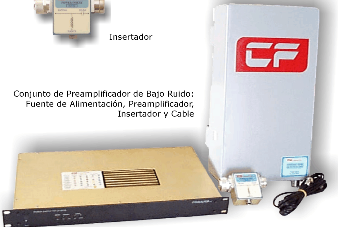
Conjunto de Preamplificador de Bajo Ruido: Fuente de Alimentación, Preamplificador, Insertador y Cable