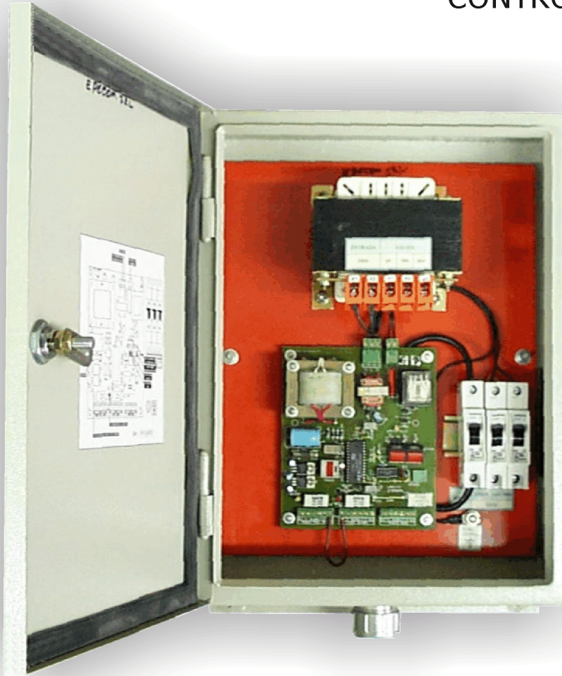
Interior del Módulo Baliza